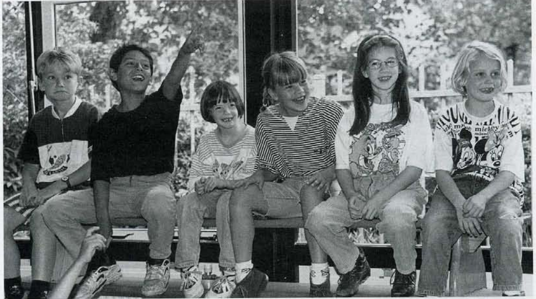
Spielen – wichtig für den Fremdspracherwerb in der Grundschule?